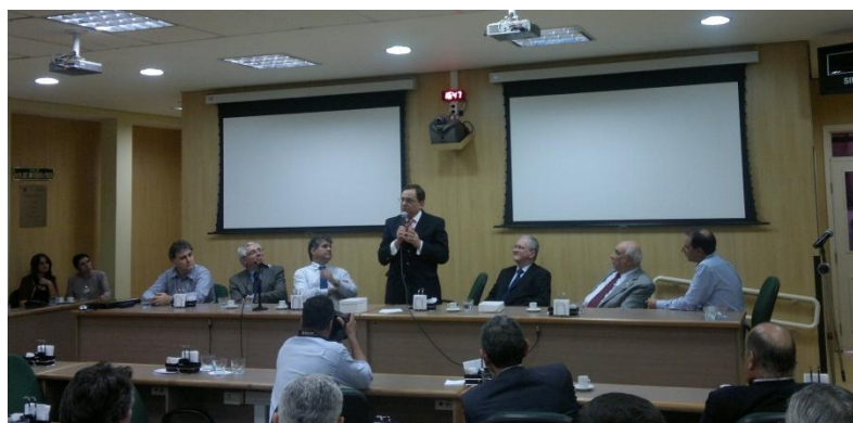
Assinatura do contrato das obras do Parque Tecnológico de Ribeirão Preto entre a USP e a empresa Sistemas Engenharia e Arquitetura LTDA, em maio de 2012.

Em abril de 2012, foi solicitado o credenciamento definitivo do Parque Tecnológico de Ribeirão Preto junto à Secretária de Desenvolvimento do Estado de São Paulo, sendo esse um grande passo para a sua consolidação.