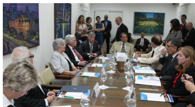
Equipe da Rice University em visita à Universidade de São Paulo.