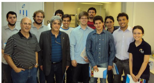
Equipe da Escola Politécnica em visita à Agência USP de Inovação.

Durante a visita à sede da Agência, os participantes assistiram a apresentações, receberam materiais da Agência e tiveram a oportunidade de conversar com os responsáveis pelos seus vários setores.