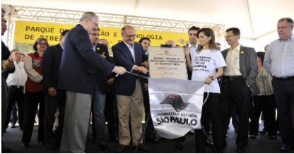
Cerimônia de inauguração do Parque.

O SUPERA Parque de Inovação e Tecnologia, instalado no Campus da USP de Ribeirão Preto, é resultado da parceria entre a USP, a Secretaria de Desenvolvimento Econômico, Ciência e Tecnologia do Estado de São Paulo, a Prefeitura de Ribeirão Preto e a Fundação Instituto Polo Avançado de Saúde (FIPASE). O objetivo principal do Parque é impulsionar o desenvolvimento científico e tecnológico da região, aproximando os setores industrial e empresarial da Universidade.