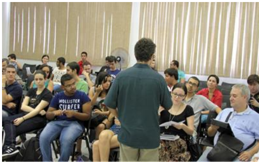
Encontro Regional da AES Brasil.