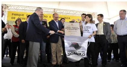
Cerimônia de inauguração do Parque.

O SUPERA Parque de Inovação e Tecnologia, instalado no Campus da USP de Ribeirão Preto, é resultado da parceria entre a USP, a Secretaria de Desenvolvimento Econômico, Ciência e Tecnologia do Estado de São Paulo, a Prefeitura de Ribeirão Preto e a Fundação Instituto Polo Avançado de Saúde (FIPASE). O objetivo principal do Parque é impulsionar o desenvolvimento científico e tecnológico da região, aproximando os setores industrial e empresarial da Universidade.