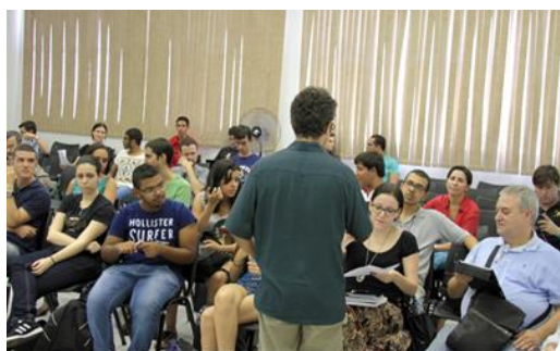
Encontro Regional da AES Brasil.